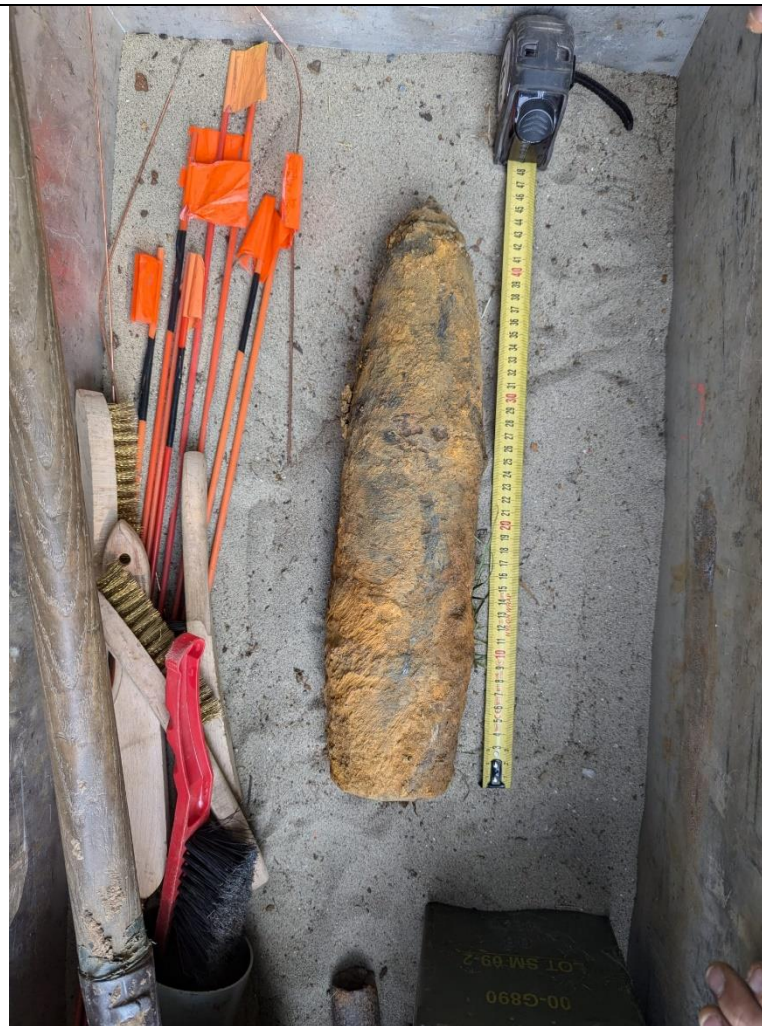
NGE in transportbox van EOD