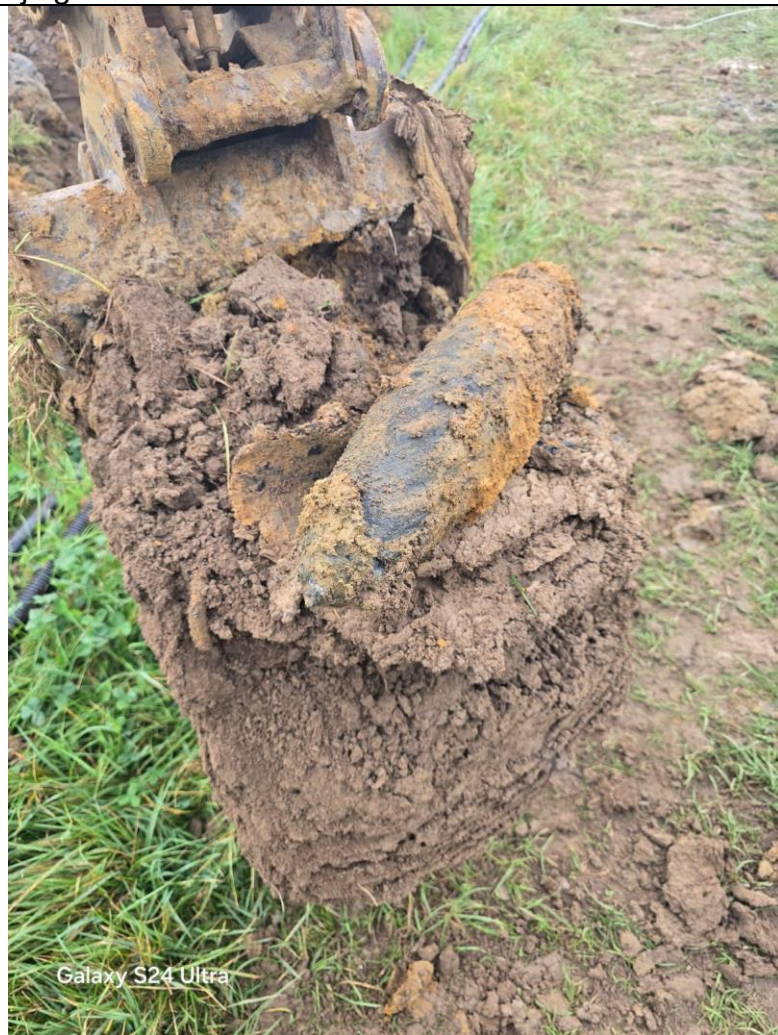
NGE zoals opgegraven